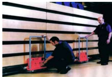
Posizionamento agevole e preciso.