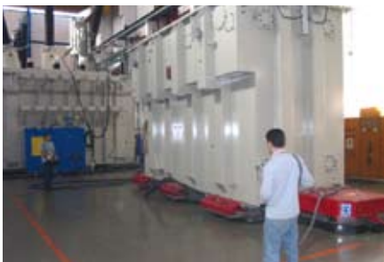
Grazie ai cuscini d'aria, il carico si solleva facilmente dal pavimento.

Il movimento è flessibile in ogni direzione e il posizionamento è agevole e preciso. L'utilizzo è semplice e facile indipendentemente dal peso del carico e non provoca alcuna usura del pavimento. Lo stesso sistema può essere usato per carichi di diverso tipo.